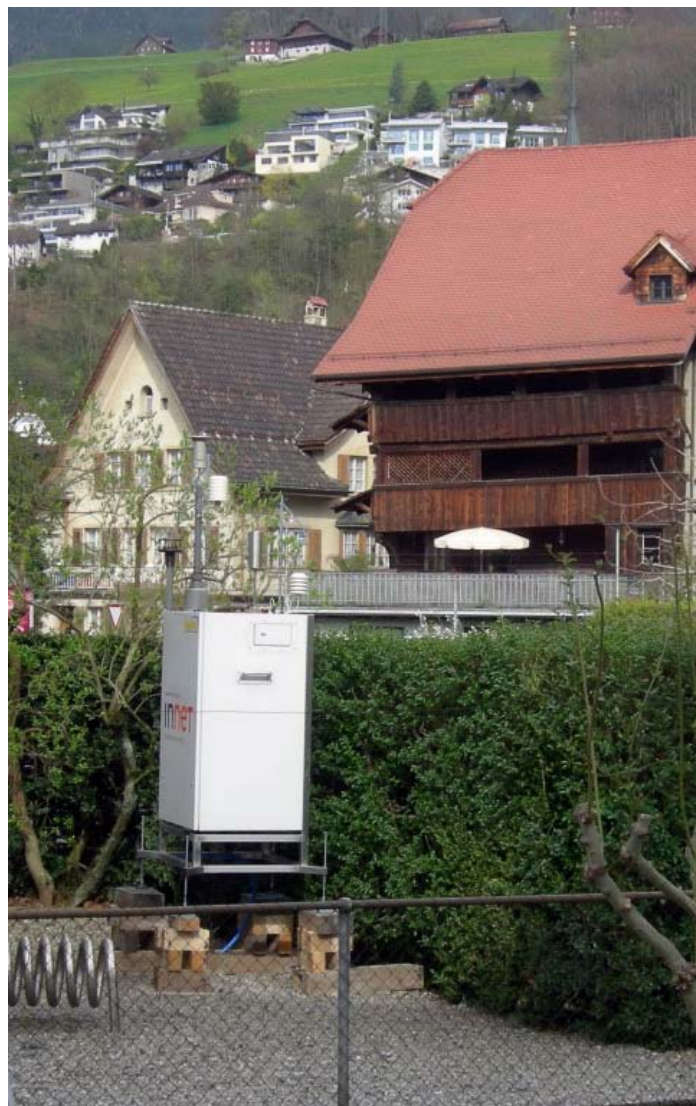
Mobile Messstationen ergänzen das Netz von stationären Messstellen in der Zentralschweiz (Bild: Sarnen).

Lesebeispiel: Der Tagesmittelgrenzwert für Feinstaub wurde in Städten mit über 25 000 Einwohnern 20 Mal überschritten.