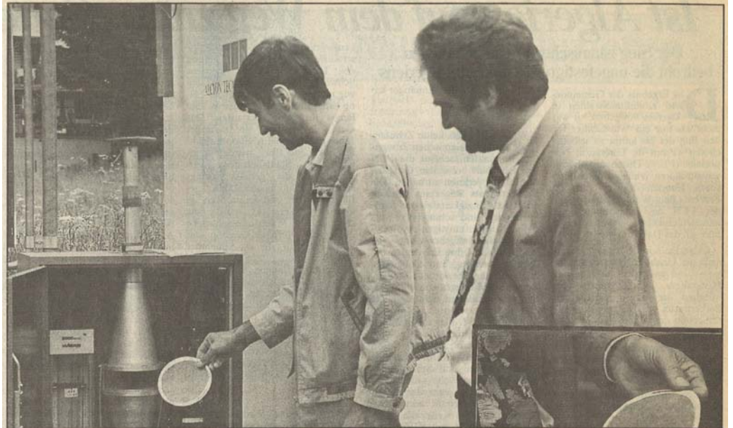
Luftschadstoffmessungen in Nidwalden: Massnahmen drängen sich auf!